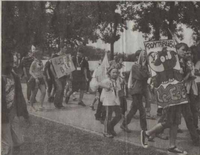
■ Durant tout le week-end de la Pentecôte, sept cents éclaireurs et éclaireuses venus de Lorraine, Franche-Comté, Rhône-Alpes et Champagne-Ardenne se sont retrouvés à Metz.

Officiellement complémentaires de l'école publique, les Éclaireurs et éclaireuses de France (EEDF), qui ont du mal à s'affirmer