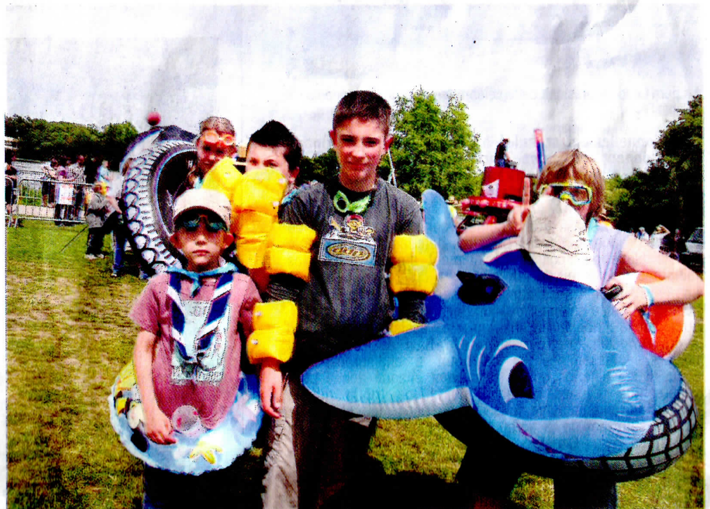
La grande parade a été agrémentée par des chorégraphies délirantes.

Et comme si cela ne suffisait pas, la parade a été