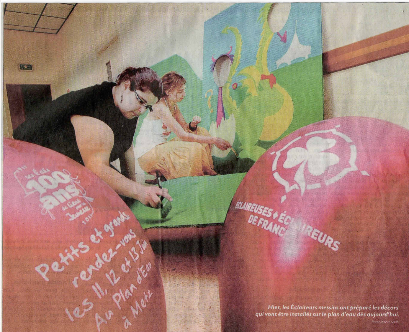
Hier, les Éclaireurs messins ont préparé les décors qui vont être installés sur le plan d'eau dès aujourd'hui.

Plusieurs centaines d'Éclaireurs de France seront à Metz ce week-end pour célébrer le centième anniversaire du mouvement scout. Un événement que les Éclaireurs messins préparent depuis plus d'un an et demi.