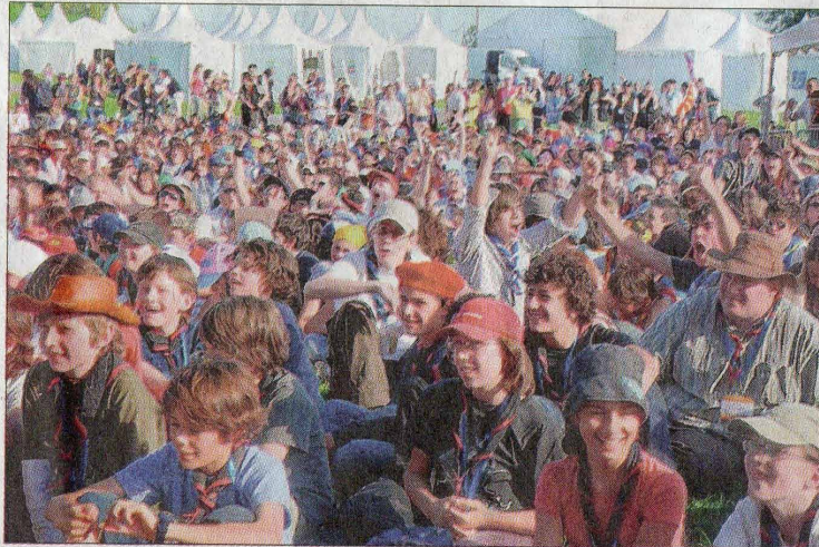
Des fêtes, des animations, des jeux, des chants, toutes les activités classiques des « Eclés », ouvertes au grand public

Aujourd'hui, en France, les « Eclés » sont 32 000, encadrés par 4 000 bénévoles et 180 sala-