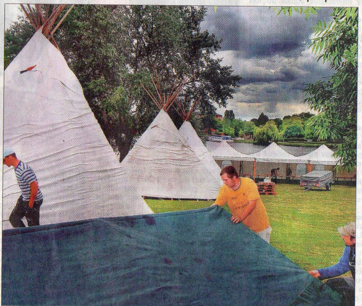
Mauvais temps ou non, l'ambiance sera à la fête tout ce week-end sur le village des tentes des Éclaireurs.

Les premiers groupes, les Mosellans, débouleront sur les pelouses dès le matin. Tout devrait être prêt. Il ne restera plus que les décors des stands à mettre en place. Pour la cinquantaine de bénévoles mobilisés sur le terrain, le plus dur sera fait.