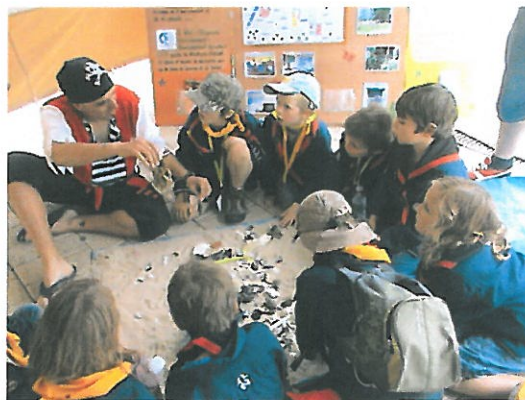
Différents moments du centenaire à Lille